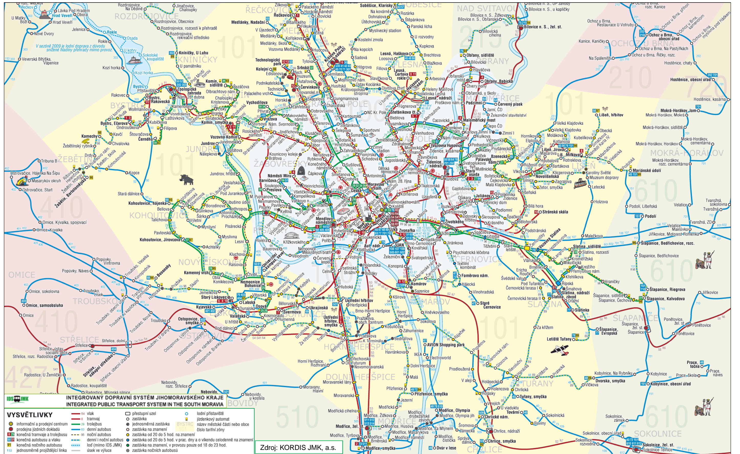
Obrázek 11 - Schéma linek městské hromadné dopravy v Brně